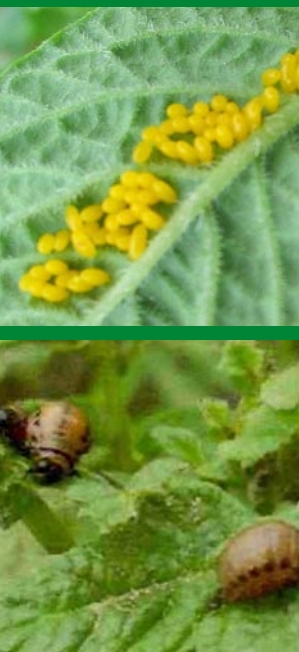
Jaja i larwy stonki ziemniaczanej