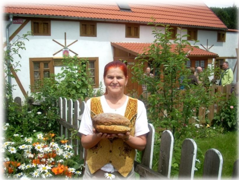
Warsztaty wypieku chleba