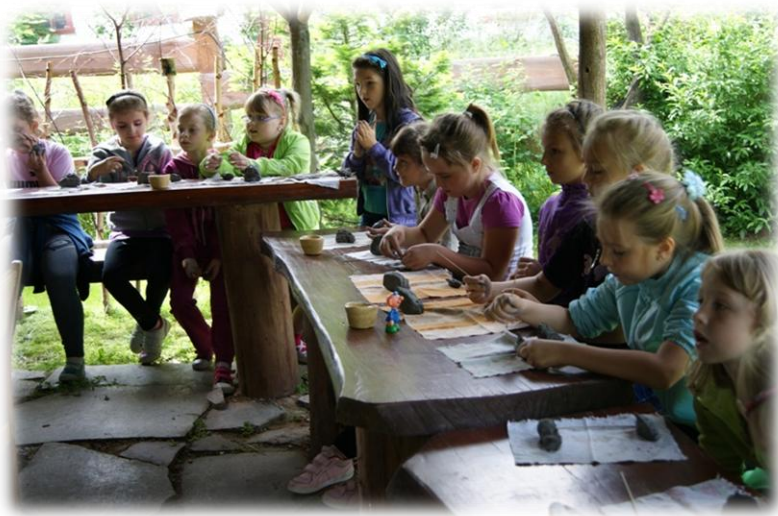
Warsztaty ceramiczne, wypieku chleba