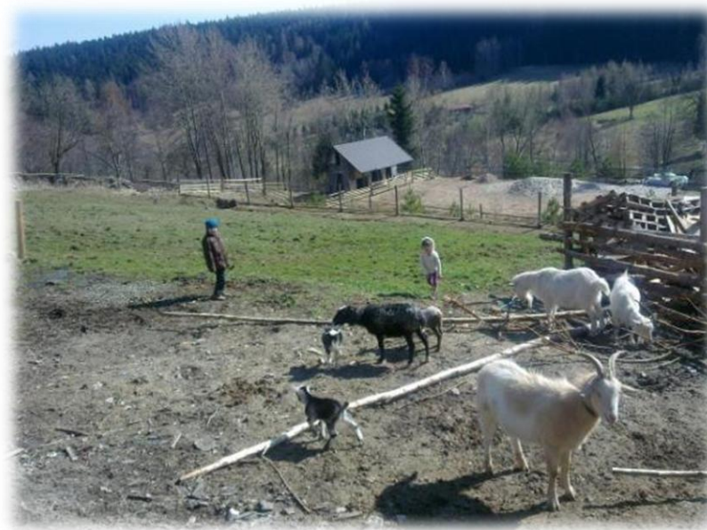
Dziedzictwo kulturowe ziemi kłodzkiej