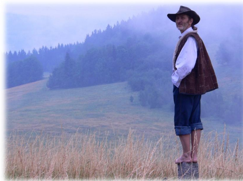
„wszystko” nt. orkiszu