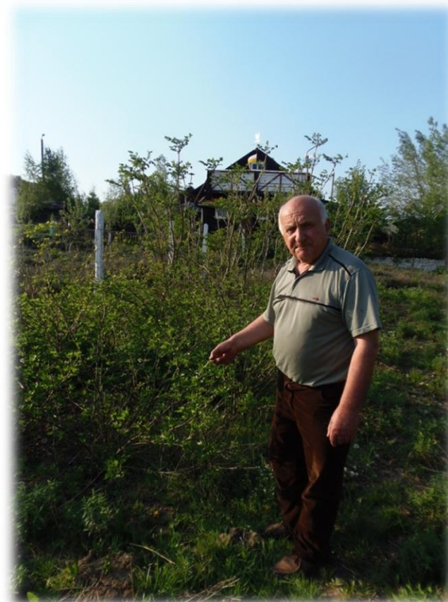
Pogadanki, warsztaty dotyczące zielarstwa, rolnictwa, dawnego sprzętu gd