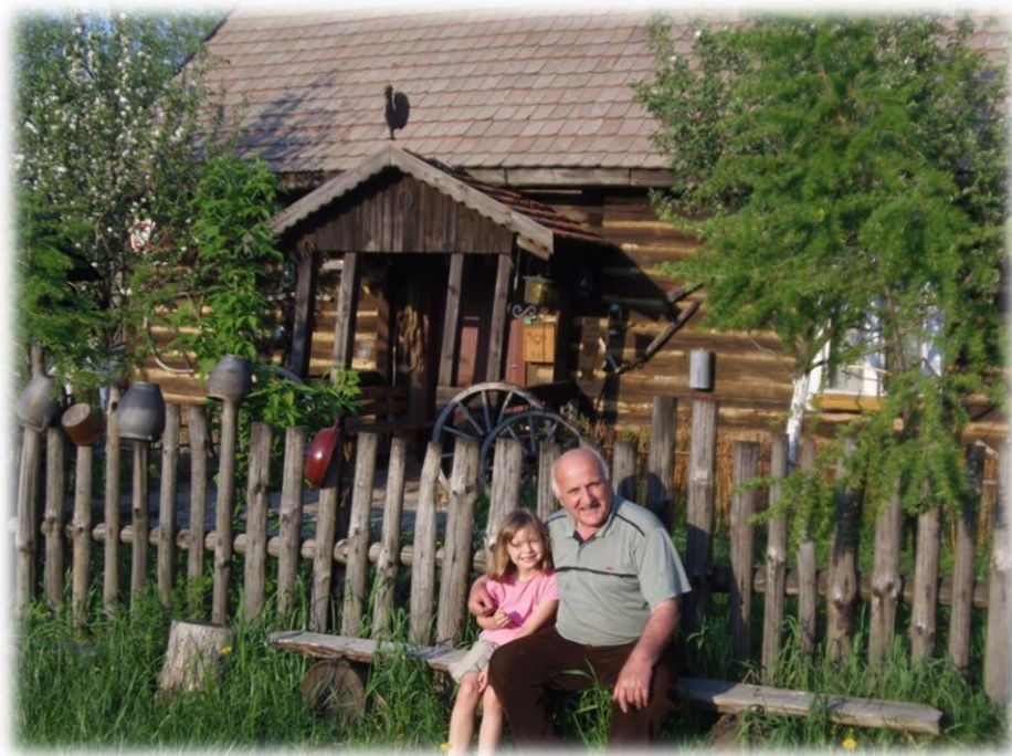
Skansen – dawna architektura