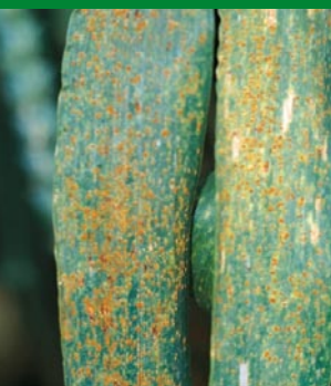
Rdza brunatna pszenicy