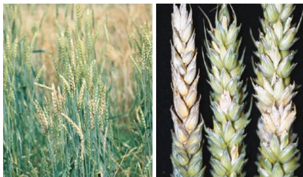
Fuzarioza kłosów – charakterystyczne zabarwienie łanu

Fuzarioza kłosów to jedna z najgroźniejszych chorób pszenicy ozimej, bowiem oprócz zmniejszenia plonu powoduje pojawienie się w przechowywanym ziarnie niebezpiecznych dla zdrowia mykotoksyn. Rozwojowi choroby sprzyja wysoka wilgotność powietrza, temperatury w zakresie 15–26°C oraz dobre nasłonecznienie w fazach kłoszenia i kwitnienia (takie warunki występują teraz).