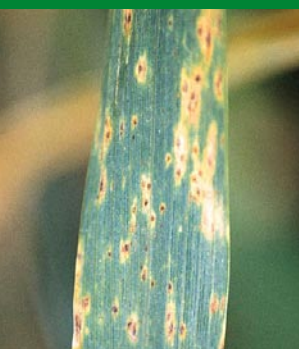
Brunatna plamistość liści

Warto obserwować także zboża jare pod kątem chorób. Jęczmień na obecnym etapie rozwoju porażony jest przez mączniaka i siatkową plamistość, a pszenica jara – przez choroby opisane powyżej.