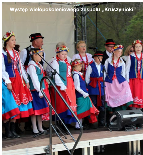
Występ wielopokoleniowego zespołu „Kruszynioki”