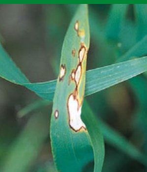
Rynchosporioza na jęczmieniu