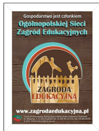
Ryc. 1. Zastrzeżone znaki słowne i słowno-graficzne