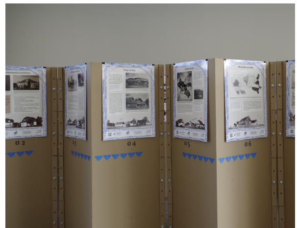
Wystawa Poniatówki Polskie