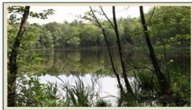
Krajeński Park Krajobrazowy - Jezioro Diabelskie