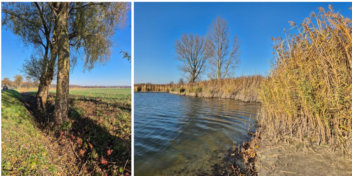
Fotografie: Stan rowu w miejscu przerzutu wody do Jeziora Wójcioskiego; Jezioro Białe