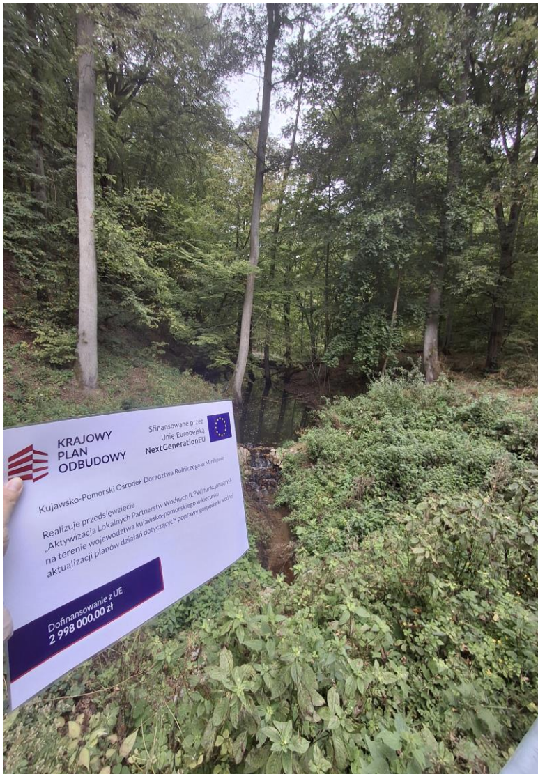
Kujawsko-Pomorski Ośrodek Doradztwa Rolniczego w Minikowie